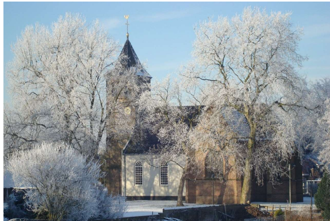
Protestantse Kerk te Bemmel

Wist u dat uw gift aan Kerkbalans (deels) aftrekbaar is voor de belasting? Meer informatie vindt u op www.belastingdienst.nl .